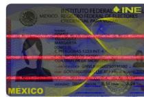
VERIFICACIÓN DE AUTENTICIDAD CON LUCES