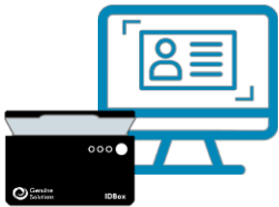
CAPTURA ID CON ESCÁNER IDBOX BLACK