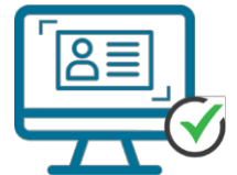
DATOS EXTRAÍDOS EN -5 SEGUNDOS

API (Application Programming Interfaces) para lectura y autenticidad de documentos de identidad, que permite digitalizar, extraer los datos y autenticar con luz UV e IR de forma rápida y automática. Así se agiliza el proceso de autenticación del documento de identidad del cliente en el punto de origen, lo que reduce exponencialmente el tiempo de espera para el cliente y de la gestión por parte de la empresa. Además se minimizan no solo los errores en los datos asociados a una introducción manual sino también se incrementa la calidad de la información. La característica más destacable es la importante reducción del fraude por suplantación de identidad debido a la autenticación del documento.