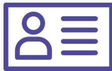
LECTURA DE DOCUMENTOS ID