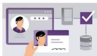
KEYBOARD EMULATOR INTERPRETA LOS DATOS