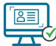
CAMPOS CONFIGURADOS DEL FORMULARIO SE AUTOCOMPLETAN

Entre los recientes casos de éxito tenemos la implementación exitosa del Keyboard Emulator en Enotel (PMS propio) y la integración directa con MEWS (OCR Server) en Palacio de Tavira . En paralelo, trabajamos junto a NORAY en la integración de ocho OCR Server en ONA Hotels , actualmente en proceso, también nos encontramos en proceso de integración con el PMS ONESAIT de la empresa Minsait , y desarrollamos una nueva versión del OCR Server compatible con escáneres TWAIN , que permitirá realizar lecturas desde dispositivos físicos.